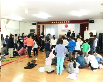
盛り上がるピンゴ大会