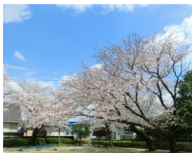
ブルースカイに映える満開の桜

3月31日(日)正午より晴天に恵まれて、平成最後のさくら祭りを公民館で開催しました。暖冬で開花時期の早まりが懸念されましたが、丁度良い満開でしたが、地域の多くの方々を始め長寿会、婦人会、自治会など約百名の参加を頂きました。