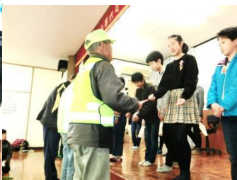
「帯山見守り隊」へ感謝状贈呈