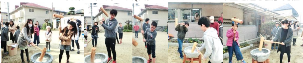
餅つきをするおともだち 貴重な体験です 右端写真の二人はとてもうまかったです