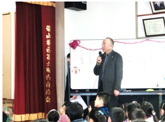
緒方自治会長 お祝いの言葉