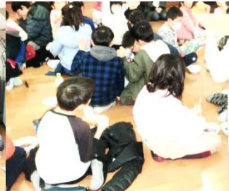
婦人会のぜんざいおいしいね