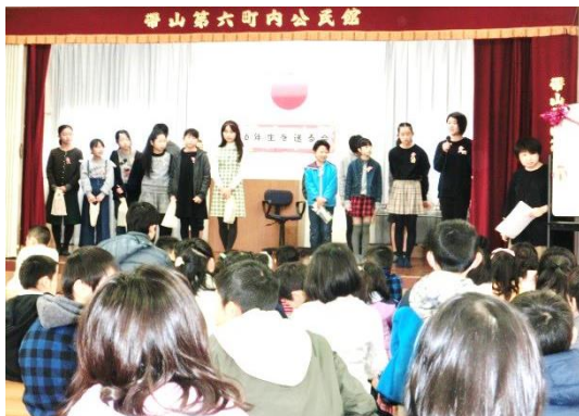
六年生代表 お礼の言葉（ステージ右端の人）