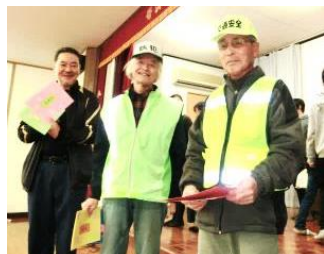
嬉しそうなお見守り隊の方々